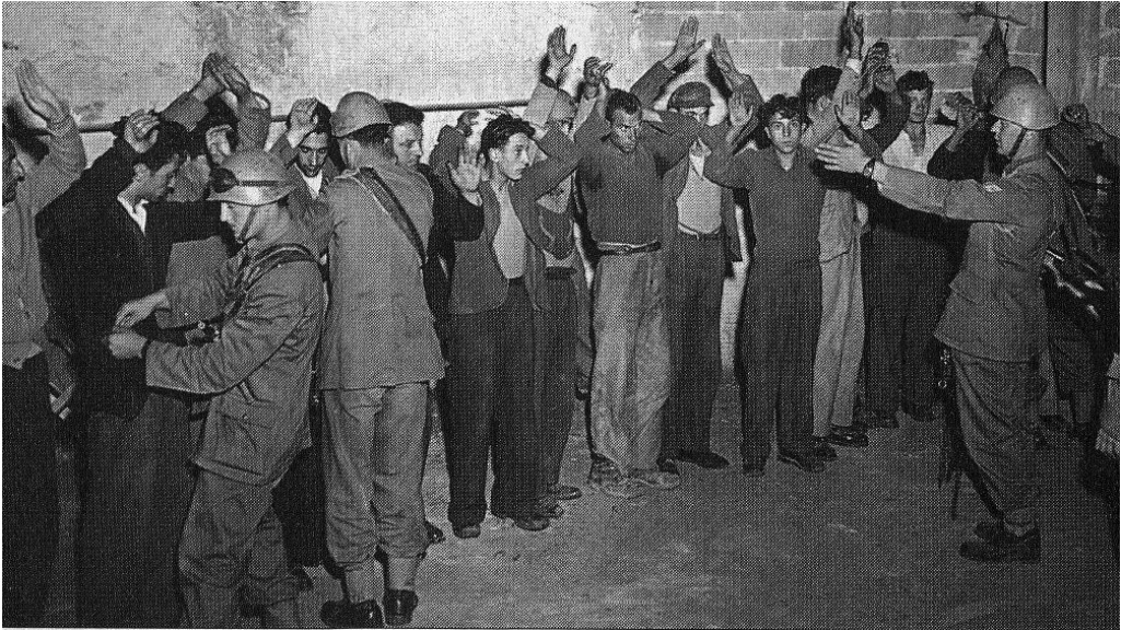
Luglio 1948, perquisizioni ad Abbadia San Salvatore

Recatosi in parlamento nel pomeriggio del giorno 15, Scelba fornì una versione di comodo di quanto successo, tacendo non solo l'indicibile (il fatto che armati erano sia i partigiani comunisti che quelli cattolici, allertati da Taviani 12 ), ma negando persino l'evidenza (l'uccisione a Genova di tre persone ad opera della polizia, fatto di cui pure la radio aveva parlato 13 ); non si occupò del tentato omicidio di Togliatti, né informò delle indagini in corso; si dilungò invece nel riferire quanto evidenziato da prefetti e questori che lo aggiornavano di continuo, spesso confusamente e sempre calcando i toni, sulla situazione dell'ordine pubblico in varie città e paesi. Giunto al termine della sua relazione, fornì poi "un'ultima notizia", relativa alla situazione creatasi ad Abbadia San Salvatore, dove «un reparto di pubblica sicurezza trovasi dislocato in una sottostazione telefonica del cavo che congiunge l'Italia settentrionale con l'Italia centrale: questo reparto sta per essere sopraffatto da migliaia di rivoltosi armati che tentano di conquistare la stazione telefonica. Rinforzi inviati da Siena sono stati accolti da bombe e impossibilitati a proseguire» 14 . Poi passò ad altro, ma il messaggio lanciato era chiaro: ad Abbadia era in atto una rivolta armata, i comunisti assaltavano con bombe le forze di polizia e volevano interrompere le comunicazioni per tagliare l'Italia in due: il piano insurrezionale cominciava a delinearsi in tutta la sua portata.