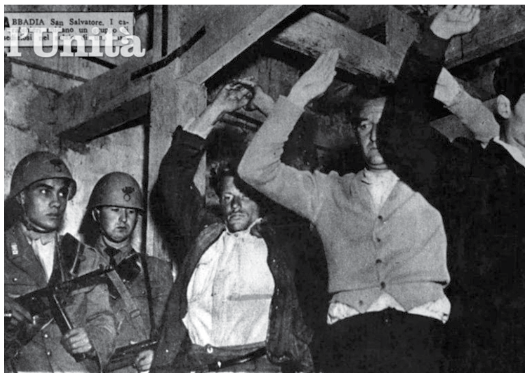
Luglio 1948, Abbadia San Salvatore

[..]. I rivoltosi posseggono mitragliatrici pesanti e leggere, bombe a mano e, sembra, un cannoncino da 47, oltre a un gran numero di moschetti e pistole 19 .